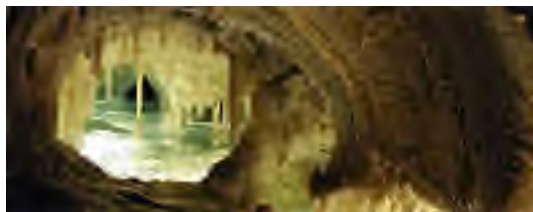
Die Obir Tropfsteinhöhlen wurden unter die Lupe genommen

Tropfsteinhöhlen wollen interessant für Kinder werden. Studenten entwickeln Unterrichtsmaterialien.