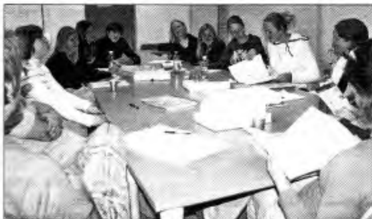
DIE STUDIERENDEN bei der Ideenfindung. Teamwork steht im Mittelpunkt.

für Schulen zu entwickeln. Den Kindern und Jugendlichen soll möglichst viel Wissenswertes über Tropfsteinhöhlen vermittelt werden. Für Studierende bedeutet dieses Projekt vor allem eines: viele Tipps für die spätere Berufswelt mitzunehmen. Ob Ideenfindung, Umsetzung, Pressearbeit, Teamwork, Design oder Ideenmanagement – diese Lehrveranstaltung gibt den Studierenden die Möglichkeit ihre Stärken in der Praxis auszubauen bzw. neue Wege kennen zu lernen. Zudem müssen die Studierenden ihre ganze Kreativität einsetzen, um ein ebenso tolles Endprodukt wie im Vorjahr abzuliefern. Und so wird gerade innerhalb wie außerhalb der Lehrveranstaltung an der Planung der Materialien gearbeitet.